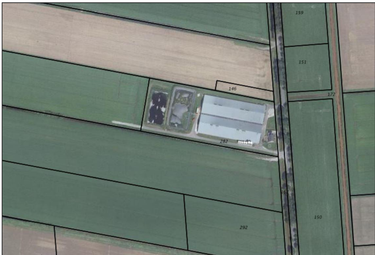
Ligging bedrijf op kadastraal perceel