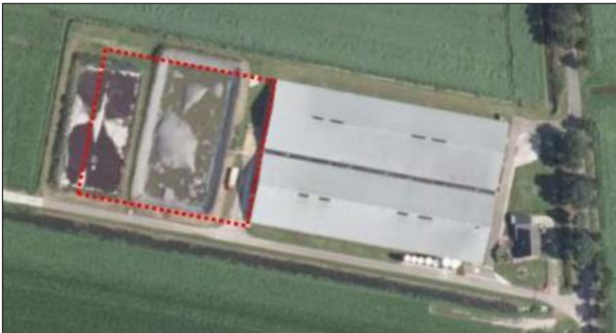
Locatie uitbreiding stal

In de nieuwe vergunde situatie is er ruimte voor het houden van 6.720 vleesvarkens op basis van een leefruimte van 1 m 2 per dier.