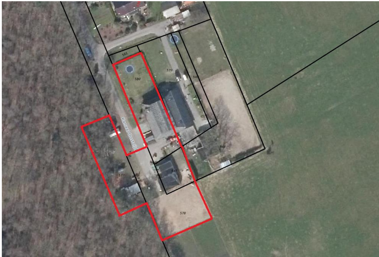
Luchtfoto kadastraal perceel