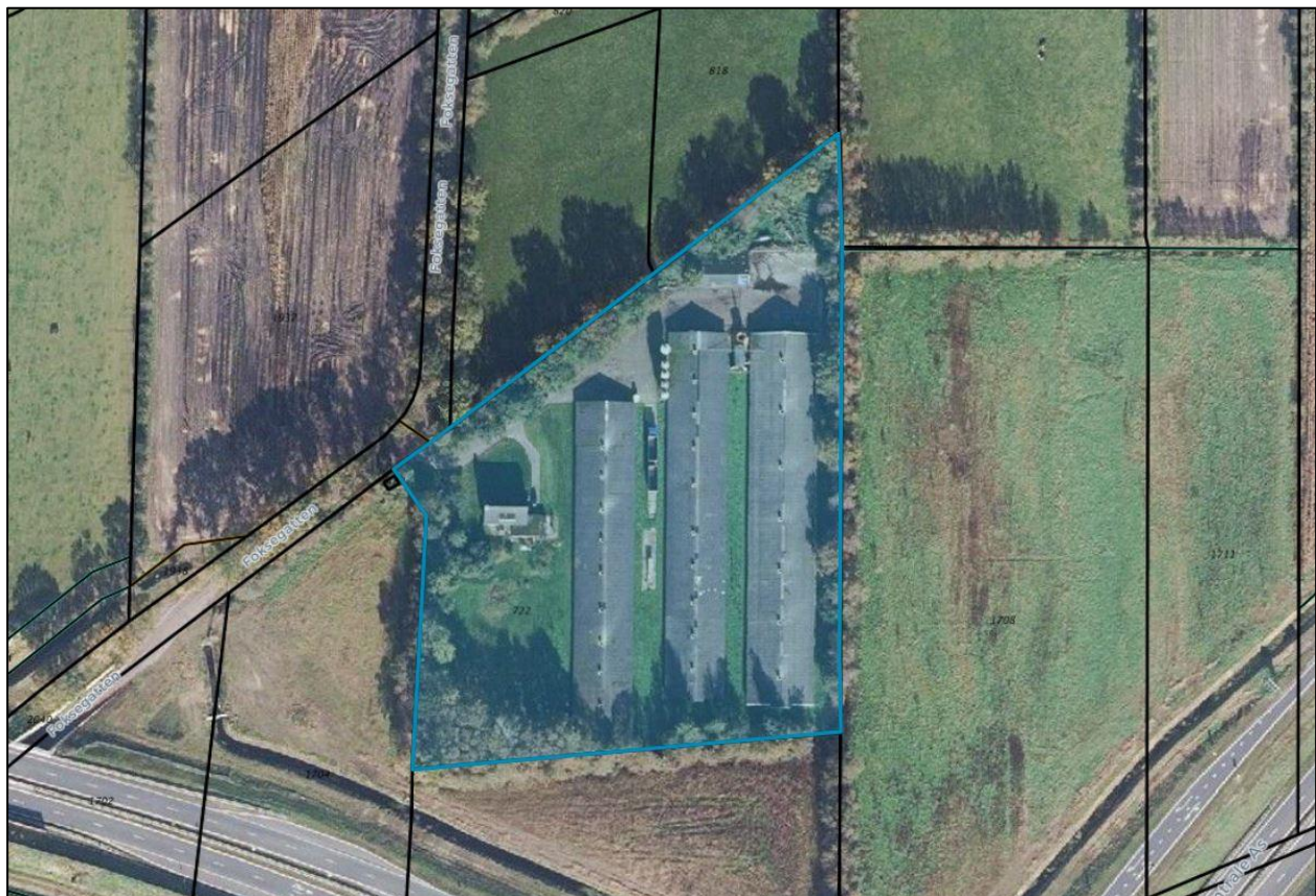
ligging bedrijf op kadastraal perceel