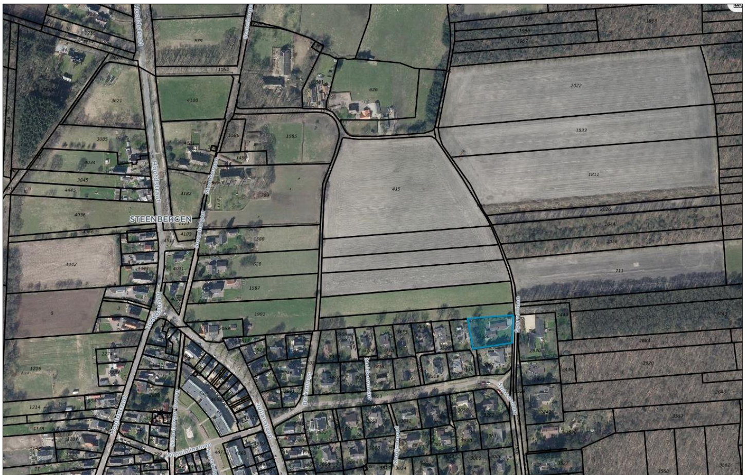
Luchtfoto kadastraal perceel